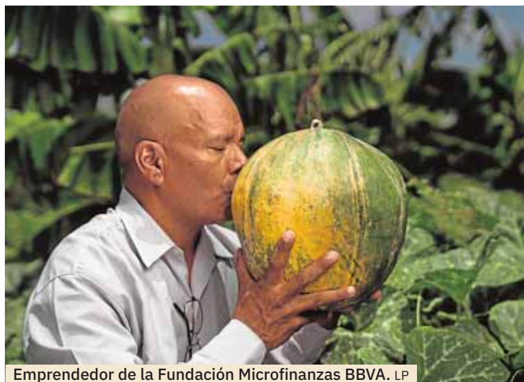
Emprendedor de la Fundación Microfinanzas BBVA. LP

Prevén iniciar la construcción de las dos primeras instalaciones antes del verano y que estén operativas a finales de 2021.