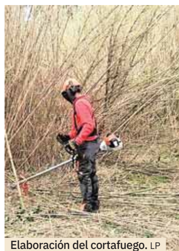
Elaboración del cortafuego.

Por ello, las brigadas forestales trabajan sin tregua sobre una superficie de 37,34 hectáreas. Del total, 8,48 hectáreas se convertirán en cortafuegos verdes. Se trabajará con desbroce, poda y clareo en 26,48 hectáreas y se eliminará la caña de una superficie de 2,38 hectáreas.